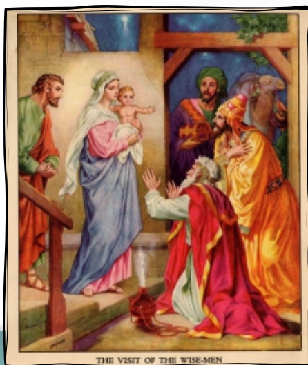
Pokłon Trzech Króli, rycina Heinricha Heffmanna, koniec XIX wieku

Za miesiąc, 6 stycznia, będziemy obchodzić święto Objawienia Pańskiego, znane powszechnie jako Trzech Króli.